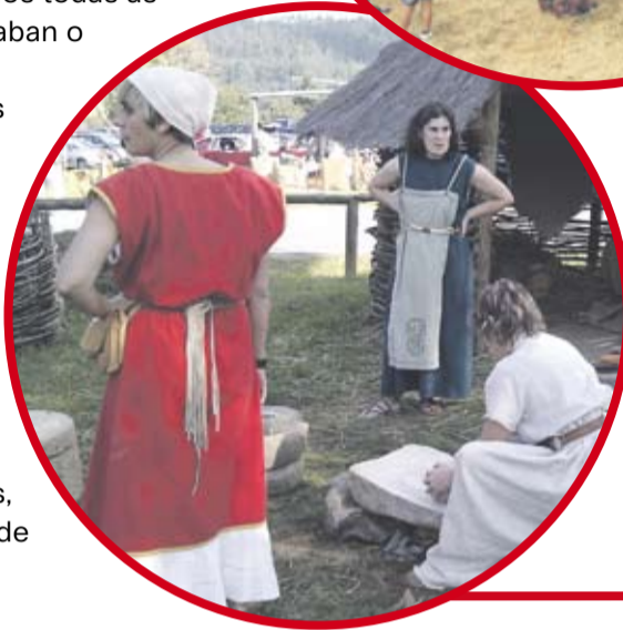
Estampas do Oenach de edicións anteriores, en que destacan as representacións teatrais.