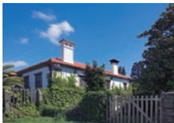
Pazo do Vento