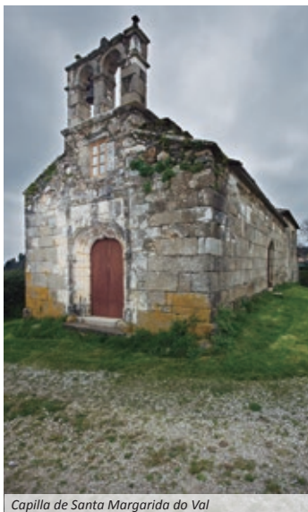
Capilla de Santa Margarida do Val

siglo XIII estaba en su esplendor. Del mismo se conservan algunos elementos incorporados en su arquitectura interior. El crucero figurado del atrio, el único de Narón que presenta la particularidad de disponer de un banco, está construido en piedra serpentina, el toelo, de las canteras de Moeche.