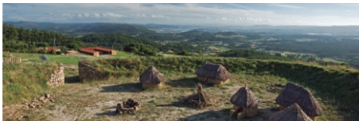
Vista general de las instalaciones del parque temático