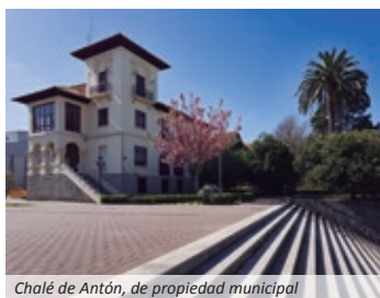
Chalé de Antón, de propiedad municipal