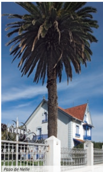
Pazo de Nelle