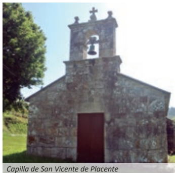
Capilla de San Vicente de Placente