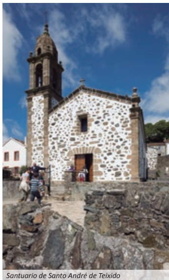
Santuario de Santo André de Teixido