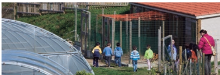
En Aldea Nova se desarrollan actividades dirigidas al conocimiento de nuestros orígenes