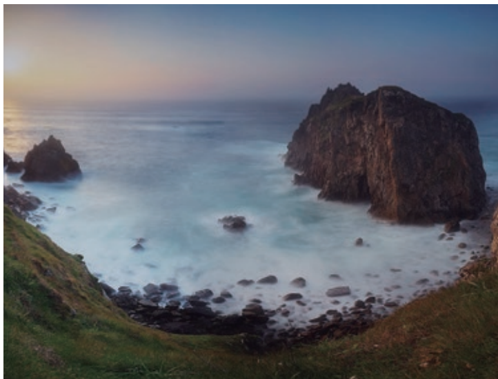
A Pena Lopesa