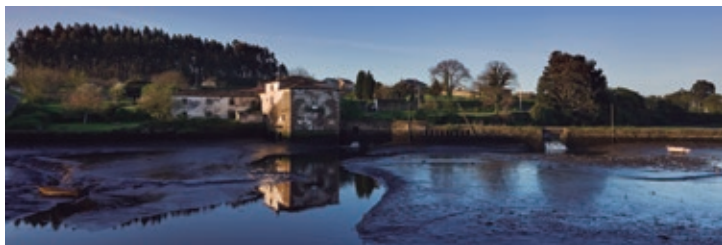
Molino das Aceas