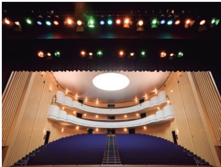
El Pazo cuenta con un escenario de mil metros cuadrados y una capacidad de novecientos butacas