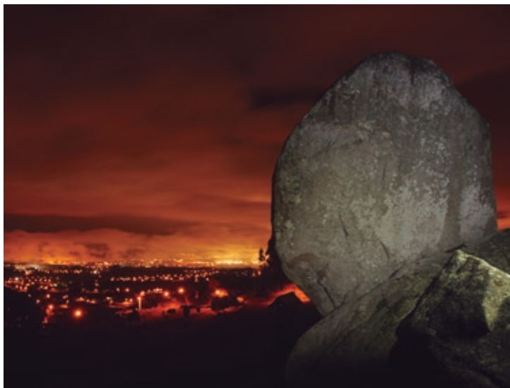
A Pena Molexa

Este conjunto megalítico destaca por su localización, su valor energético, la técnica constructiva con la que fue erigido y considerado un observatorio astronómico precedente al del crómlech de los Almendres en Portugal (de 8.000 años de antigüedad) o del famoso Stonehenge (de 5.100 años de antigüedad). A Pena Molexa tendría también la función de “banco”, y serviría para que la comitiva fúnebre pudiese escenificar –manifestación mantenida viva hasta hoy– la recepción del alma del rey, tras superar una prueba por la mora (mujer de la mitología gallega) y posterior transporte en la barca lunar a omóríka (el más allá).