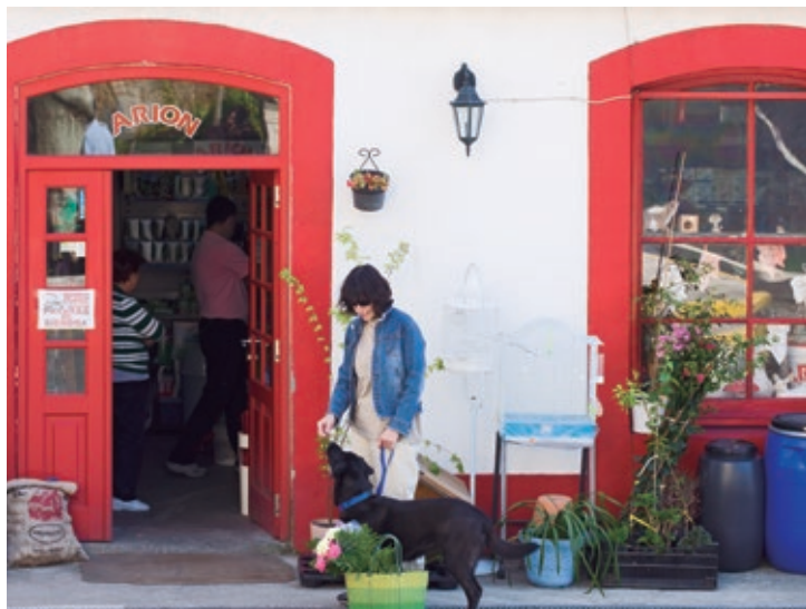
El comercio tradicional tiene una extraordinaria importancia en Narón, incluso en el núcleo urbano