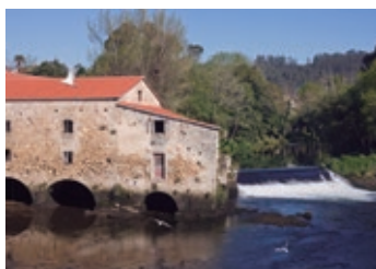
Molino de Xuvia