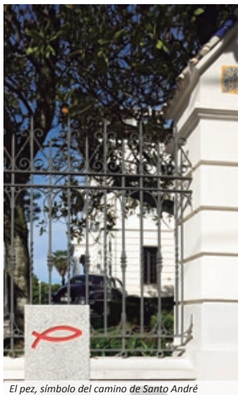
El pez, símbolo del camino de Santo André