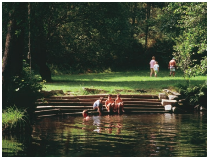
Área recreativa del molino de Pedroso