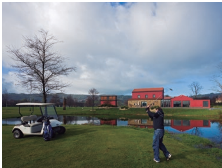
Los amantes del golf cuentan con un espacio perfecto en las instalaciones del Club Campomar