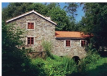
Molino de Pedroso