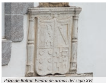
Pazo de Baltar. Piedra de armas del siglo XVI