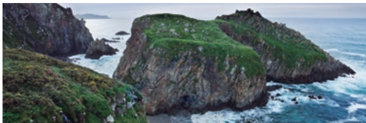
Costa de Narón. A Pena Lopesa entre las calas de O Casal y Lopesa