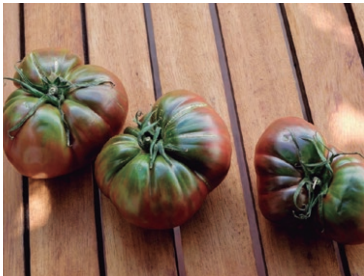
Tomate Negro de Santiago