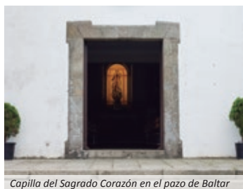
Capilla del Sagrado Corazón en el pazo de Baltar