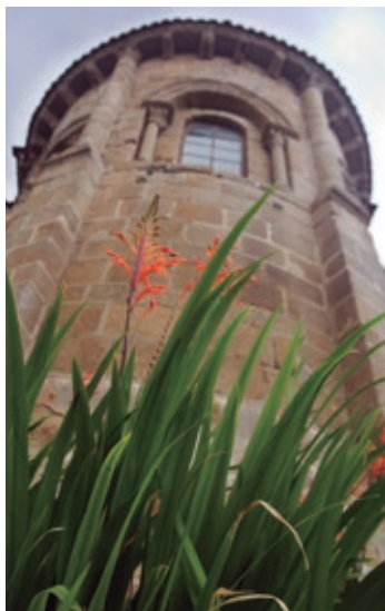
Ábsida do mosteiro do Couto. Detalle