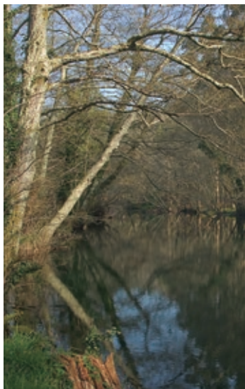
Ribeiras do río Xuvia