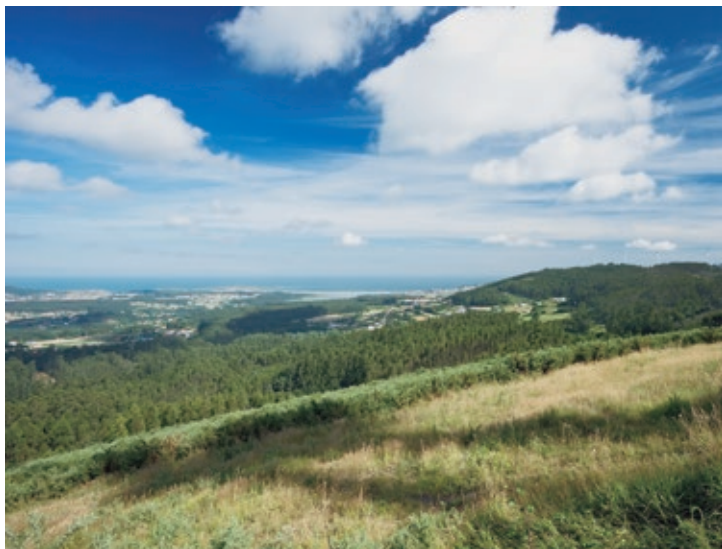
Vista dende o Monte dos nenos