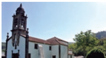
Igrexa de Santo Estevo (Sedes)