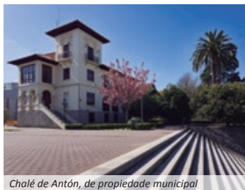
Chalé de Antón, de propiedade municipal