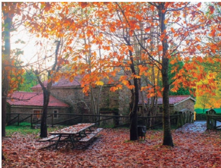
Área recreativa do Muíño de Pedroso