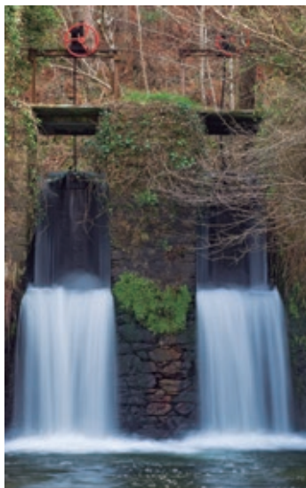
Comportas na presa do Rei