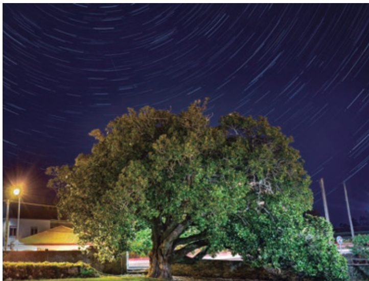
A Magnolia grandiflora é testemuña da vida dos naroneses dende hai máis de 200 anos