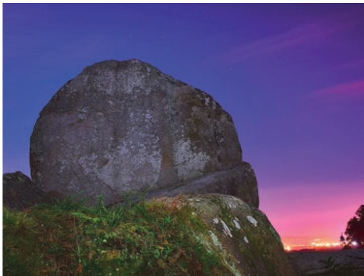
Sen dúbida este é un dos lugares máxicos de Narón