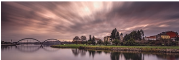
Ponte sobre a ría e paseo marítimo de Xuvia