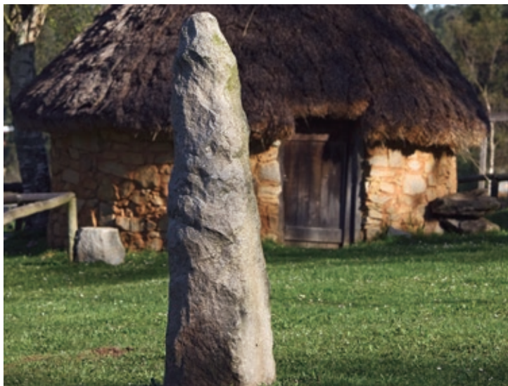
Feira do Trece: recreación de palloza e menhir