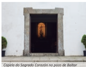
Capela do Sagrado Corazón no pazo de Baltar