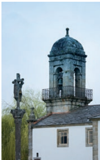
Igrexa de San Salvador de Pedroso e cruceiro