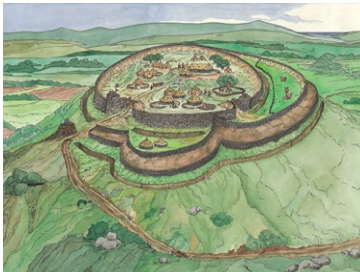
Recreación do castro de Eiravedra