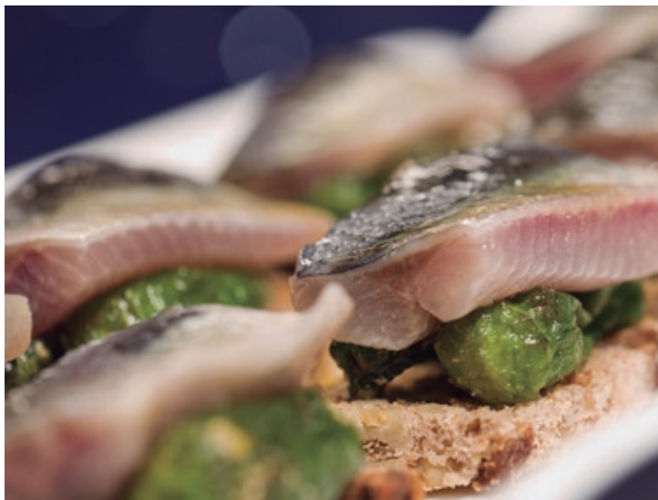
Pemento do Couto, produto estrela