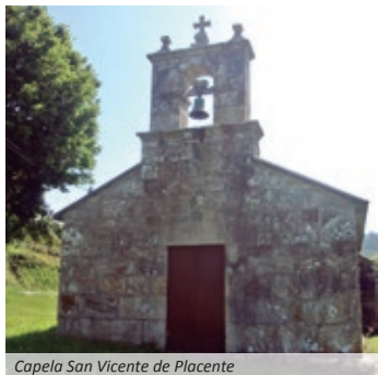
Capela San Vicente de Placente