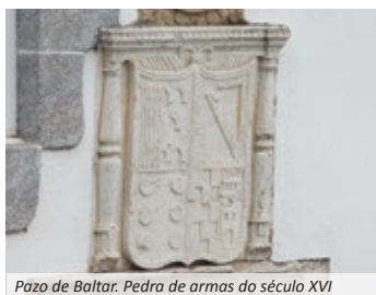
Pazo de Baltar. Pedra de armas do século XVI