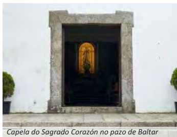
Capela do Sagrado Corazón no pazo de Baltar