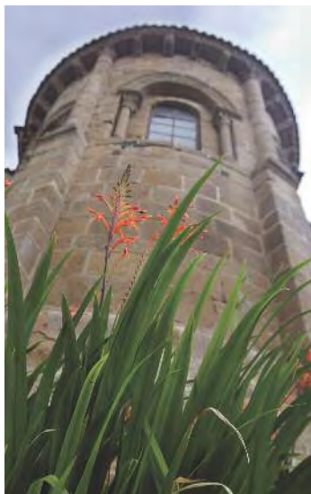
Ábsida do Mosteiro do Couto. Detalle