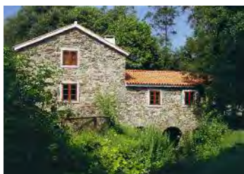
Muíño de Pedroso