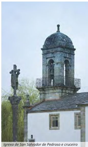
Igrexa de San Salvador de Pedroso e cruceiro

Estes enterramentos baseábanse maioritariamente nun ritual funerario colectivo, sendo os finados acompañados de diferentes obxectos de connotación ritual: machados de pedra, puntas de frecha, colares, recipientes cerámicos, etc.