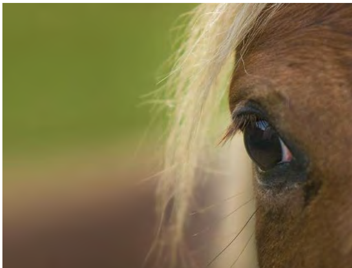
A Feira do Trece é un clásico entre as feiras de Galicia