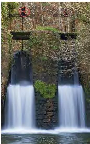
Comportas na Presa do Rei

Durante parte do século XX, a magnolia estivo protexida de preto ao ser a antiga fábrica de toneis Cuartel da Garda Civil durante case cincuenta anos. Como anécdota dicir que nunha ocasión incluso foi refuxio antiaéreo durante un bombardeo. Na actualidade o acceso a ela é público.