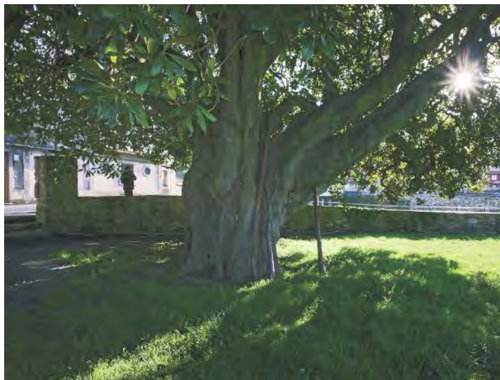
A Magnolia Grandiflora é testemuña da vida dos naroneses dende hai máis de 200 anos