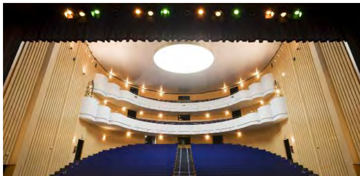
O Pazo conta cun escenario de mil metros cadrados e un aforo de novecentas butacas

turais á vez que é sede da Escola Profesional de Teatro e das escolas de baile, música e danza do Padroado de Cultura. Acolle a meirande parte da programación que ata hoxe se celebraba no Auditorio, que xa quedou pequeno co devir dos anos.