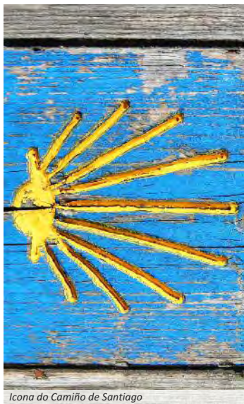
Icona do Camiño de Santiago