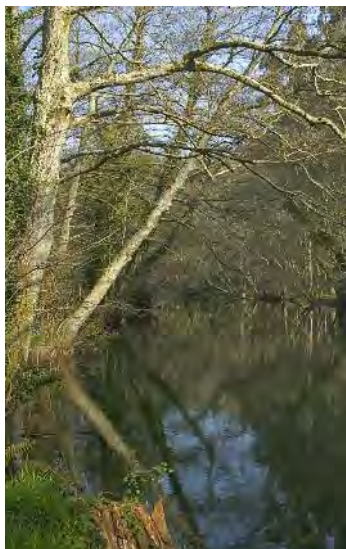
Ribeiras do río Xuvia