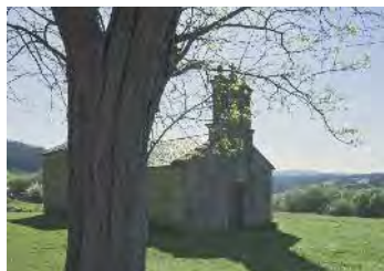
Ermida en Sedes