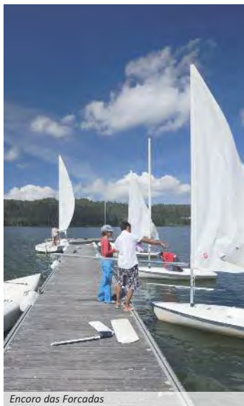
Encoro das Forcadas

polos municipios de Valdoviño e Cedeira. Comezaremos subindo cara ao Outeiro do castro de Petouzal, cuberto de bosque, para baixar despois ao muíño das Aceas. Atravesando a estrada de Castela, o camiño pasa preto do castro de Sequeiros, percorrendo a corredeira de Feal e outros camiños que levan á Pena de Embade.