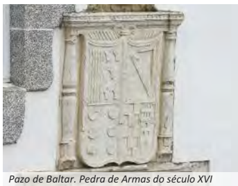
Pazo de Baltar. Pedra de Armas do século XVI

A capela da O lembra cando, nos tempos de seca, sacábase a Virxe da O en procesión para conseguir que chovese. Malia que non sempre o deu feito, froito da forte devoción popular construíuse esta sinxela capela na súa honra e creouse a romaxe que aínda se mantén nos nosos días. Nos arredores da capela da O atópanse a ponte de Chao e os muíños de Perfecto e Chao.