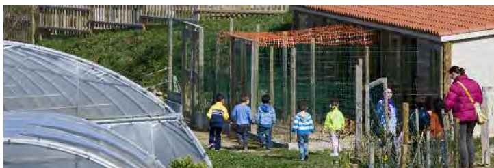
En Aldea Nova desenvólvense actividades dirixidas ao coñecemento das nosas orixes

ata un cruceiro. Neste punto, o peregrino torce á dereita para enlazar co camiño do Salto. Toma despois a senda peonil que, sen abandonar en ningún momento a ribeira da ría, chega ata unha central eléctrica que hai que rodear por detrás. Desviándose cara á dereita, o camiño desemboca no muíño das Aceas e a súa ponte, que cómpre cruzar.