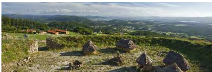
Vista xeral das instalacións do Parque Temático