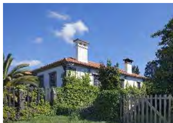
Pazo do Vento