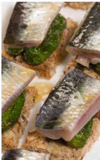
Pemento do Couto, produto estrela

ción por parte do Centro de Investigacións Agrarias de Mabegondo, conseguindo que se extenda polas diferentes hortas galegas cunha grande aceptación. Dende o ano 2012 é cultivado e comercializado pola Cooperativa do Val en Narón, facendo un verdadeiro esforzo para devolver esta variedade ao mercado.