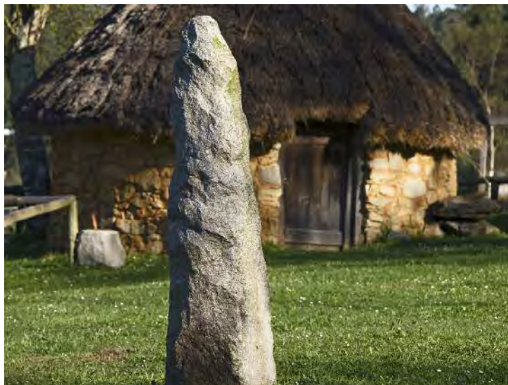
Feira do Trece: recreación de palloza e menhir