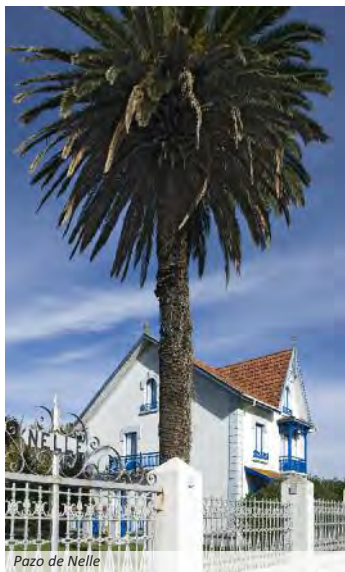
Pazo de Nelle