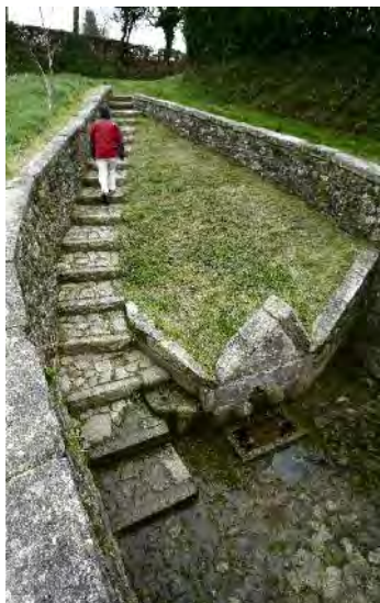
Fonte de Santa Margarida, preto da ermida