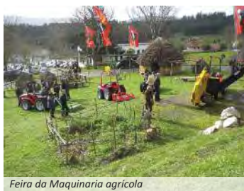
Feira da Maquinaria agrícola