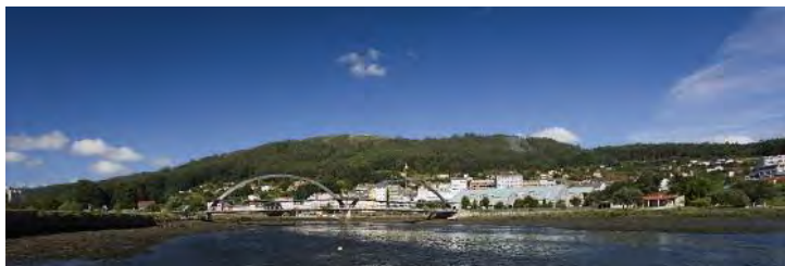
Ría e Monte de Ancos dende o paseo de Xuvia