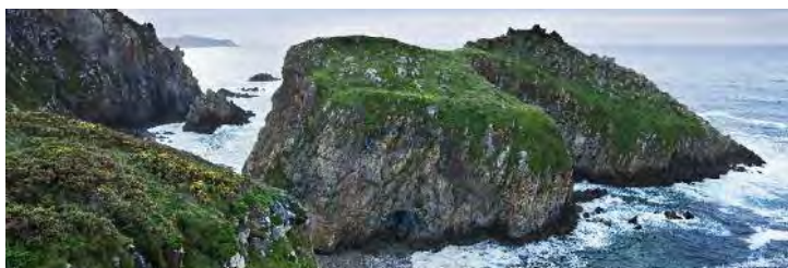
Costa de Narón. Pena Lopesa entre as calas de Casal e Lopesa