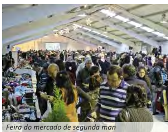
Feira do mercado de segunda man