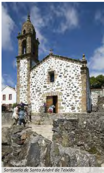
Santuario de Santo André de Teixido