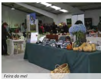
Feira do mel