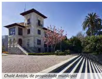
Chalé Antón, de propiedade municipal