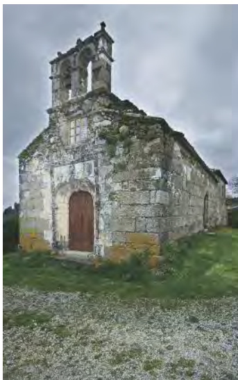
Capela de Santa Margarida do Val