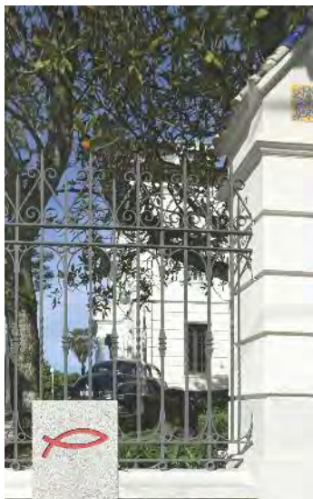
O peixe, símbolo do camiño de Santo André