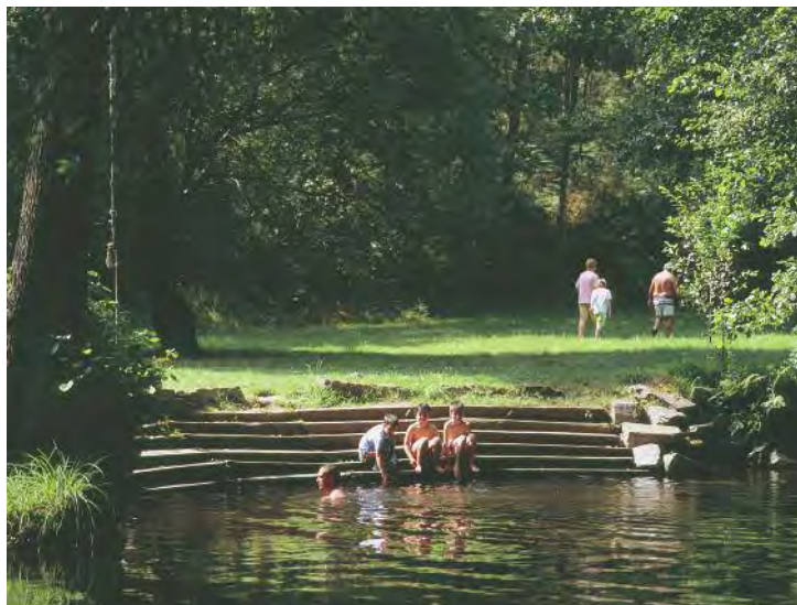
Área recreativa do Muíño de Pedroso