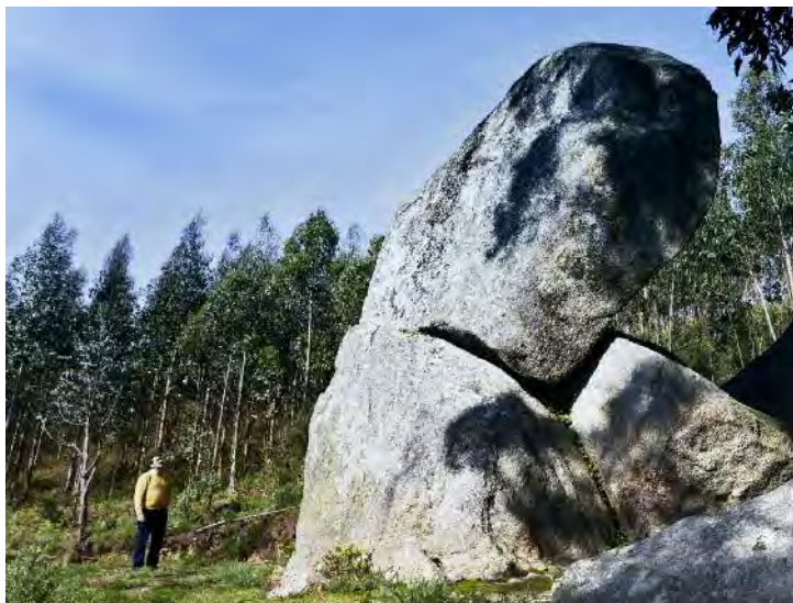
A grandiosidade da Pena Molexa causa admiración entre os visitantes