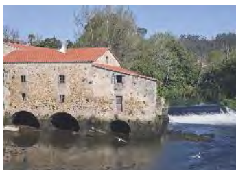
Muíño de Xuvia