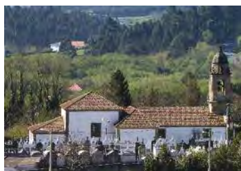
Igrexa de Santo Estevo de Sedes