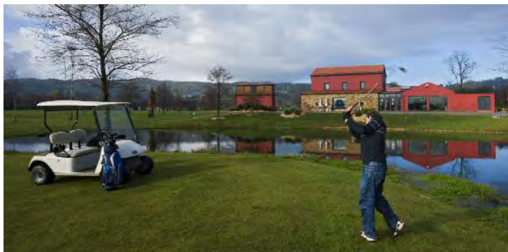
Os amantes do golf contan cun espazo perfecto nas instalacións do Club Campomar