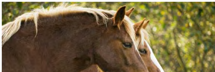
A Feira do Trece é un clásico entre as feiras de Galicia