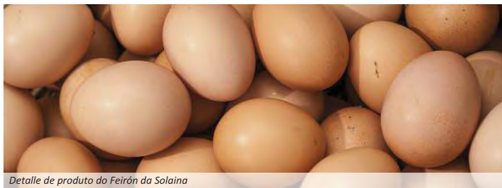
Detalle de produto do Feirón da Solaina