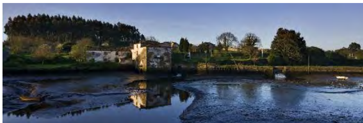
Muíño das Aceas