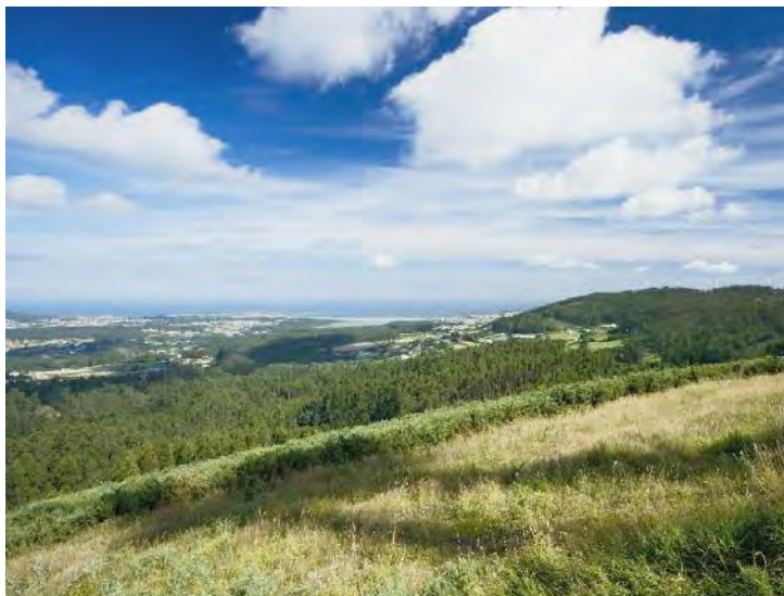
Vista dende o Monte dos Niños

Si permiten a visita o de Eiravedra , o castro prevalente de Narón. Domina a paisaxe e o territorio, desde o val de Pedroso á ría de Xuvia e ata as terras de San Sadurniño. A súa forma é ovalada, cunha muralla no interior e un terraplén cara ao exterior.